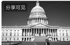
20年旅游回忆录——国际篇(三)