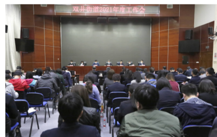
街道年度工作会现场