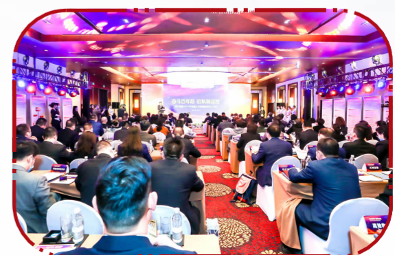
党建工作协调委员会会议现场