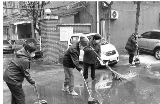
社区志愿者清扫路面积水