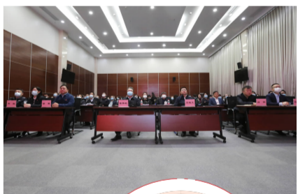
街道年度工作会现场