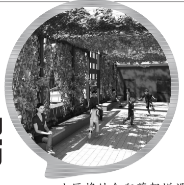
小区将结合爬藤架增设晾衣杆