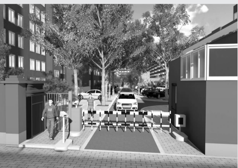
小区改造后将实行人车分流