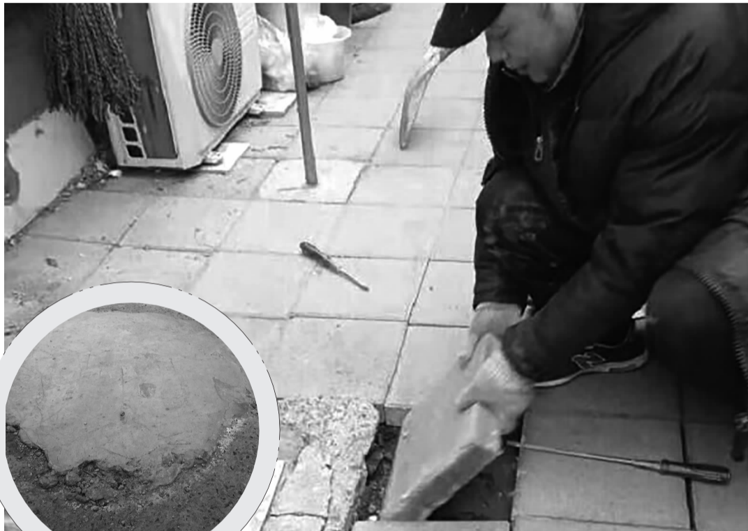
工人对塌方路面进行维修