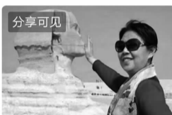
20年旅游回忆录——国际篇(二)