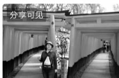
20年旅游回忆录——国际篇(一)