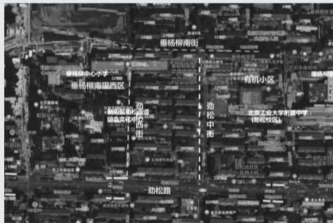
垂南街区改造点位图

在实施老旧小区改造过程中,将持续征集居民“心愿清单”,对居民反映的问题进行探讨和研究,参照设计方案进行改进,最终改造要让居民住得安心、舒心。“如居民反映的问题无法及时处置的,社区也将及时做好沟通、解释工作。”