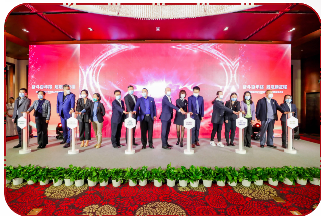
会议现场,15家委员单位共同点亮“心愿灯柱”。