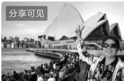
20年旅游回忆录——国际篇(四)