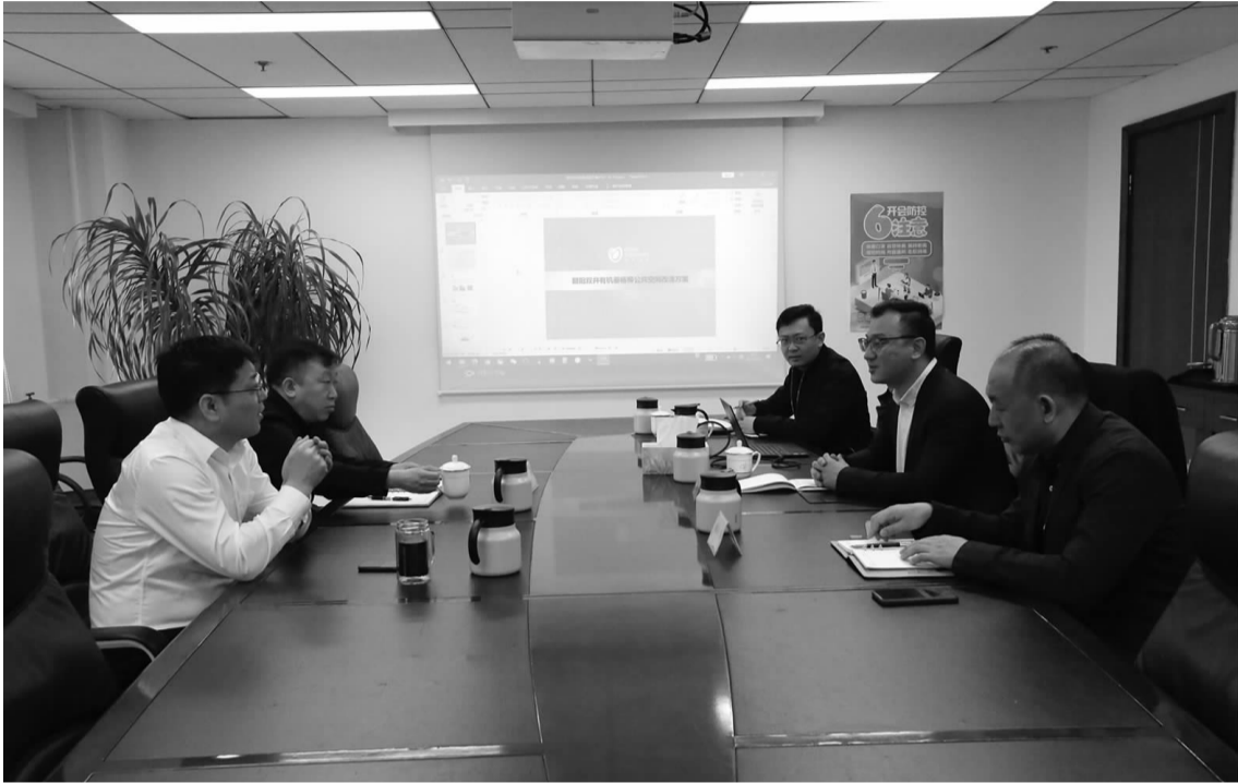
双井街道召开垂杨柳南里老旧小区改造方案汇报会

改造将对公共活动进行空间集中化,以方便社区内居民都能够参与使用,同时合理有效的对老旧小区停车空间进行整治和规划。为推动垂南街区更新改造,双井街道协调东方石化和北京愿景集团签订战略合作协议,按照“政府平台+多元主体+社会资本”的合作模式合力推动垂南街区更新和品质提升,计划于6月底前先打造“一条街和一个院”的样板。改造后的垂南街区将成为居民们的梦想“家”,想想就觉得很激动呢!