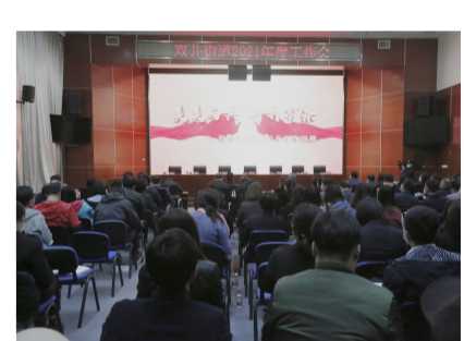
书写“美美与共、井井有条”的发展新篇章