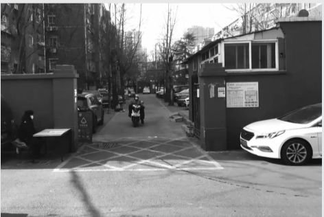
小区改造前的大门