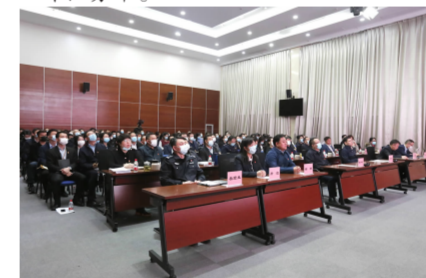
与会人员认真观看2020年度街道工作宣传片